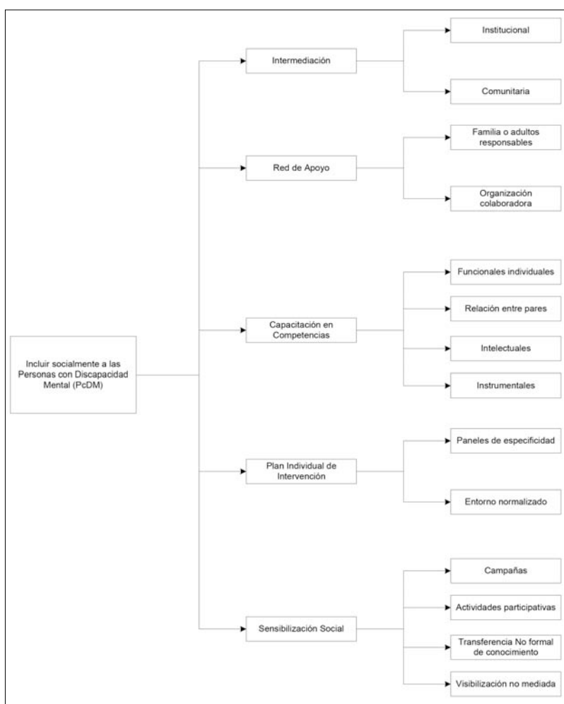
FIGURA 2. ESTRUCTURA JERÁRQUICA: COMPONENTES Y SUBCOMPONENTES DEL MODELO DE INTERVENCIÓN SOCIAL DE CECAP EN LA PLENA INCLUSIÓN SOCIAL DEL COLECTIVO

Subcomponente 4: Visibilización no mediada. El subcomponente de visibilización no mediada se entiende como aquellas acciones de sensibilización “pasiva” que se realiza hacia los agentes sociales. En este sentido, se refiere a la acción de propiciar la disminución de las barreras de acceso, por medio de la